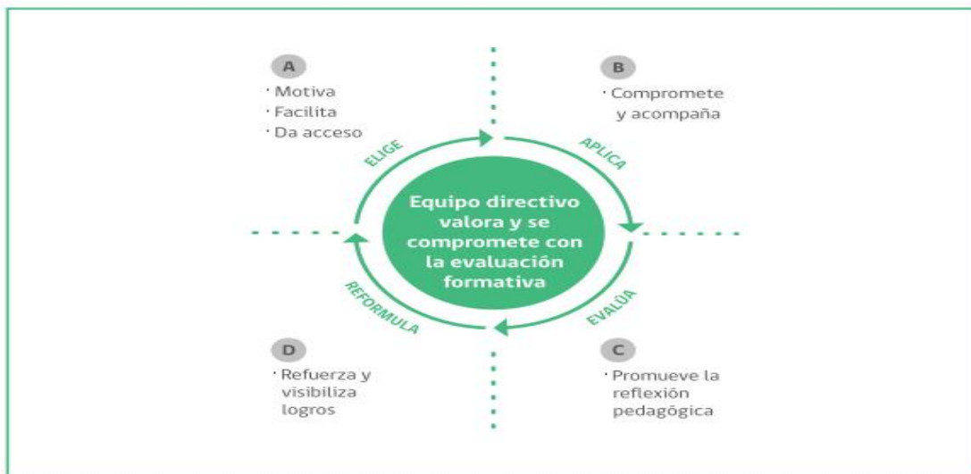
Diagrama 1: ciclo de uso de la evaluación formativa (guía de evaluación formativa por la agencia de la calidad de la educación)